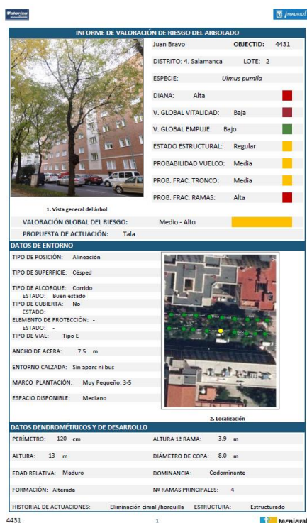
Vista del página inicial del informe

El modelo de ficha diseñado para la toma de datos en campo se ha realizado en base a la propuesta publicada por Matheny y Clark ( Tree Hazard Evaluation Form en el libro Evaluation of Hazard Trees in Urban Areas ) y a la ficha de valoración de Riesgo utilizada para la evaluación del arbolado Viario de Madrid, publicada en los pliegos de condiciones vigentes en el presente contrato.