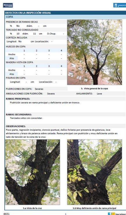
Vista de datos de Inspección de copa

A continuación se presenta de manera resumida los aspectos más importantes que se ha elegido tomar sobre cada uno de los árboles inspeccionados: